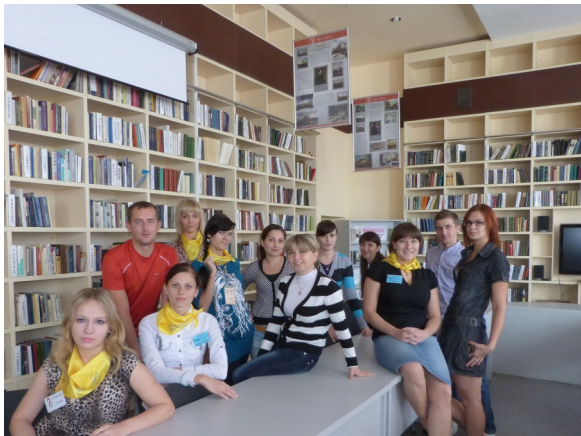
Молодіжне відділення УБА

Кожний молодий бібліотекар в Україні має можливість об'єднатися зі своїми колегами, аби спільно робити життя в професії цікавим, змістовним та корисним для себе і