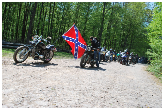
Колона байкерів вирушає до місцевої історичної пам'ятки

Тишу містечка раптово розриває гуркіт десятків двигунів старанно відполірованих мотоциклів, сяючих хромованими відблисками. Байкери... Хто вони? Просто проїжджі мотолюбители чи безтурботні вершники на залізних конях? Зовсім ні. Ці чоловіки в шкіряних куртках – це користувачі Іллінецької центральної районної бібліотеки. Суворі «погоничі» Асоціації незалежних байкерів спрямовують своїх «залізних коней» просто до центрального входу місцевої бібліотеки, щоб насолодитися новими можливостями, які вона надає. Власники «залізних коней» стверджують, що потужні байки надають неосяжну свободу та бажання рухатися вперед. Це бажання також втілюється завдяки бібліотечним інтернет-послугам, які пропонують спільноті байкерів безмежні можливості для спілкування.