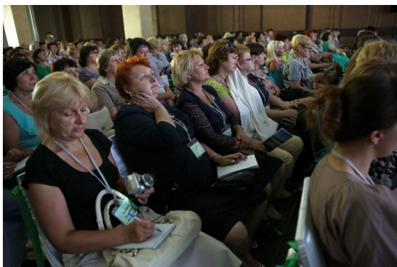
На відкритті ярмарку в «Холі чемпіонів» яблуку не було де впасти

24 липня НСК «Олімпійський» знову став бібліотечним фронтом змін на краще, що протягом останніх років крокують країною. На головну бібліотечну подію року — ярмарок