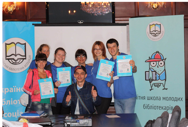
Молоде покоління — майбутнє бібліотечного сектору

Бібліотечна молодь розпочала «студії» з ознайомлення з інноваційними підходами в роботі Івано-Франківської обласної універсальної наукової бібліотеки ім. І. Я. Франка.