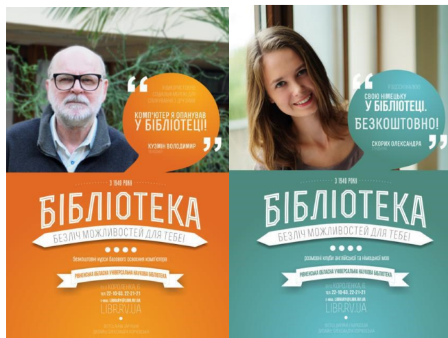
Фото користувачів бібліотеки відтепер можна побачити на сітлайтах міста