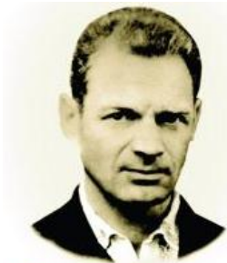
ОЛЕКСА ТИХИЙ 1927-1984

Громадський діяч, правозахисник, педагог