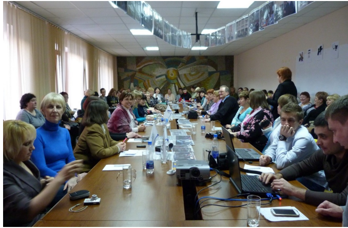
Конференція «Славське-2013» збрала бібліотекарів з усієї України

Конференція проходила в цікавому інтерактивному форматі: команди учасників відвідали численні майстер-класи, брали уроки у адвокаційній, психологічній, дидактичній майстернях, отримали поради у Школах майбутніх лідерів «Як стати директором бібліотеки» та «Як стати вченим-бібліотекознавцем». В межах конференції відбулись акція «Бібліотечна фотосушка» (кожен тренер привіз із