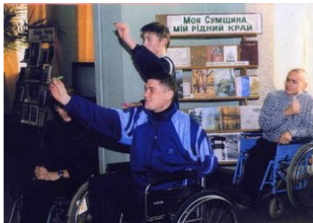
Спільно з членами спортивного клубу інвалідів «Фенікс» в бібліотеці проводяться змагання з шахів, шашок, дартсу