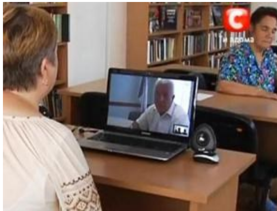
Бориспільці на «Скайп»-зв'язку з мером

Анатолій Федорчук, зі свого боку, радіє ініціативі бібліотеки: «Люди вірять, бо дійсно багато сталося змін. Вони мають можливість розповісти про наболіле: приходять та розповідають про все, від комунальних проблем навіть до стосунків в сім'ї». Для пана Федорчука робота у віртуальній приймальні приносить задоволення. В офісі міськради черги коротші, менше паперового документообігу, ухвалення рішень оперативне, а потреби городян – як на долоні. Бібліотекарі з задоволенням