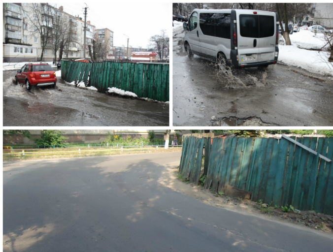
Фото проблемної ділянки вулиці до та після початку роботи онлайн-приймальні мера в бібліотеці

Бібліотекарі місцевої книгозбірні добре розуміють, що самих комп'ютерів недостатньо, аби бібліотека перетворилася на серце громадського життя. Тож отримавши новенькі машини, попрямували на місцевий ринок: де ще можна напряду поспілкуватися з містянами та почути, що є актуальним для