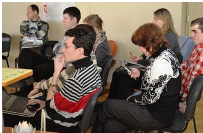
Твівент у Херсонській ОУНБ

Майже всі учасники вінницького твівенту стали користувачами бібліотеки і підписалися на щомісячну електронну розсилку новин та анонсів заходів ОУНБ. У Херсоні частина твітерян взагалі потрапили до бібліотеки вперше після тривалої перерви і були здивовані тому, як сучасні технології у бібліотеці співіснують із традиційними послугами. «Не був у бібліотеці вже майже 10 років. Цікаво було бачити, як школярі і студенти ще ходять читати книги. Думав, що книги вже давно читають на рідерах та планшетах», – написав один з гостей у своєму блозі. Одним з результатів заходу став тренінг з нових медіа, розроблений для