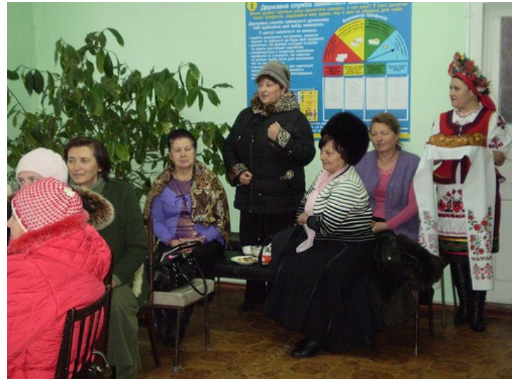
Мешканки Катеринополя навчаються в бібліотеці використовувати ІКТ та допомагають одна одній подолати сімейні проблеми

Катеринопільська центральна районна бібліотека відома своїми ініціативами, продиктованими потребами місцевої громади. Завдяки гранту від програми «Бібліоміст» тут створили бібліотечну службу швидкої допомоги для жінок «Берегиня», покликану протидіяти конфліктам у сім'ї та безробіттю місцевого населення. Наразі чотири місцеві мешканки, які зазнали домашнього насилля, стали активними користувачками бібліотеки і отримують консультації психологів через інтернет. Крім того, 20 учасників пройшли навчання комп'ютерної грамотності, користувачками бібліотеки стали 50 осіб, а 22 читача знайшли роботу.