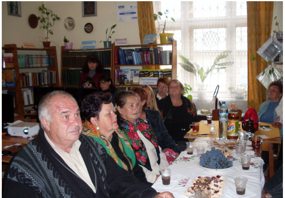
«Виборчі вечорниці» у Тур'ї-Реметі

До реалізації проекту були залучені бібліотеки-філії сіл Сімер, Тур'я-Пасіка, Раково, Тур'я-Ремета та Порошково. Консультанти інформаційного пункту Перечинської ЦРБ та волонтери сільських бібліотек провели десять виїзних