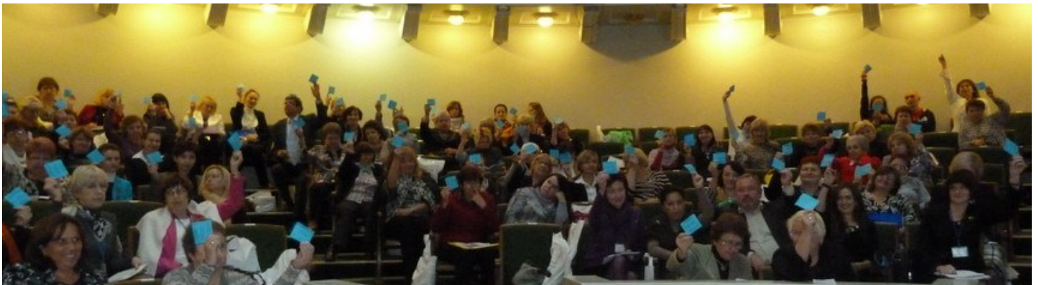
Обрання нового Президента УБА