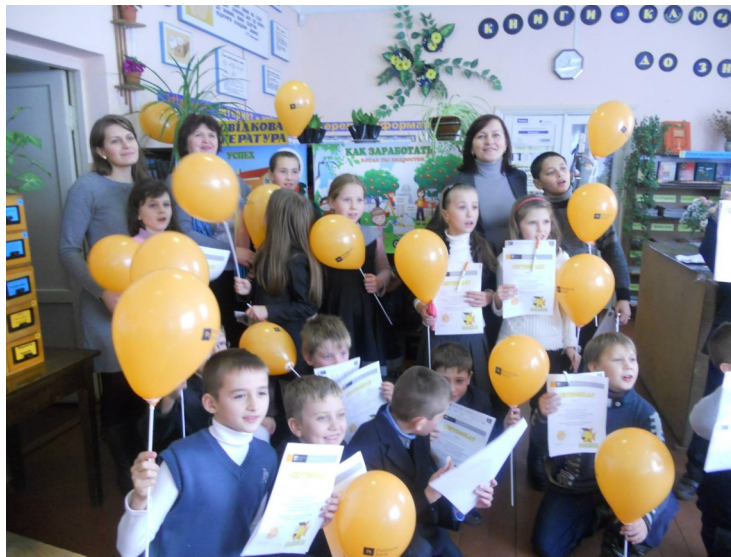
Учні 3-5 класів м. Суми дізналися все про гроші і фінанси

Бібліотека-філія №4 Сумської міської ЦБС теж провела фінансові посиденьки. 52 школярі третіх-п'ятих класів разом з представниками банку вивчали азбуку