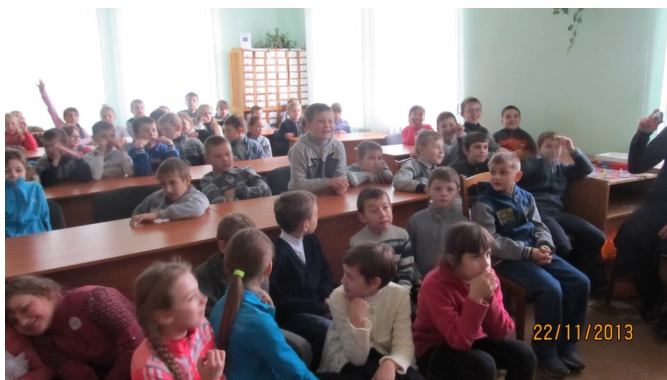
Переповнена Красилівська бібліотека під час проведення курсів фінансової грамотності

Як навчитися краще планувати свій бюджет чи розбиратися з банківськими процедурами? Можна звернутися за допомогою до спеціалістів у відділення банку, а можна просто завітати до бібліотеки на тренінг. У вересні минулого року програма «Бібліоміст» запропонувала «Платинум-банку» розширити географію та можливості школи фінансової грамотності, включивши до неї сучасні бібліотеки