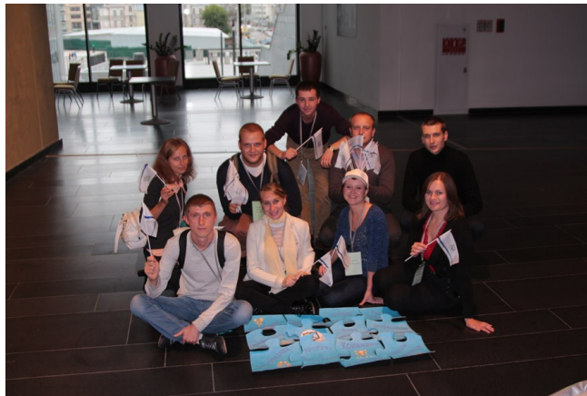
Молодь УБА на ярмарку бібліотечних інновацій

У 2013 р. члени секції брали активну участь у конференціях, форумах, конгресах, школах, що проходили в Україні, Росії, Білорусі та Польщі. Визначним заходом міжнародного рівня, участь у якому ініціювала МС УБА разом із Секцією УБА з адвокатури, став велопробіг в рамках ініціативи Cycling for libraries від Амстердаму до Брюсселю. А проведення Літньої школи молодого бібліотекаря в с. Поляниця, Івано-Франківської обл. не тільки сприяло підвищенню рівня професійного розвитку 30 молодих бібліотекарів з різних