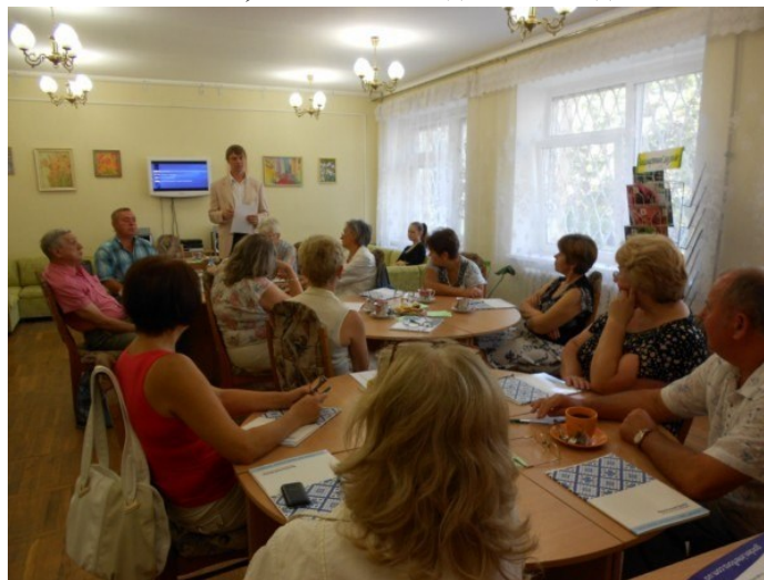
Стоп-кадр із репортажу Полтавського телеканалу «Місто» про фокус-групи аналітичного центру на базі бібліотеки (ефір за 01.08.2013 р.)