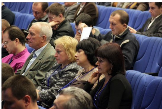
Команда тренерів з е-урядування, м. Рівне

29 жовтня 2013 р. в «Українському домі» відбувся Міжнародний науковий конгрес «Інформаційне суспільство в Україні», організаторами якого було Державне агентство з питань науки, інновацій та інформатизації України. До участі у конгресі програма «Бібліоміст» запросила переможців конкурсу «Е-урядування: реальний