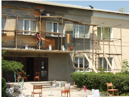
Ремонт в Арцизькій бібліотеці