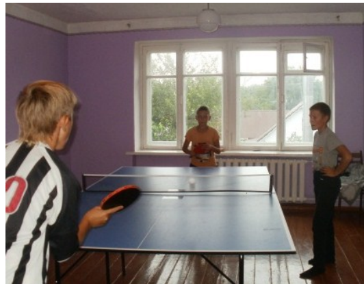
У культурно-розважальному комплексі с. Жовтнєве можна навіть пограти в теніс

Ці нововведення безпосередньо вплинули на життя місцевої громади.