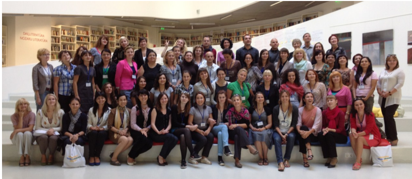
Учасники та тренери Академії у бібліотеці міста Парвента, Латвія

Протягом чотирьох днів бібліотекарі взяли участь у тренінгах з досвідченими експертами й відвідали сесії, присвячені адвокації, залученню громади, оцінюванню потреб користувачів, збору даних, менеджменту, залученню