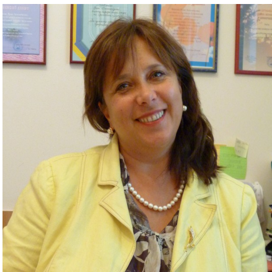
І.О. Шеченко, Президент УБА