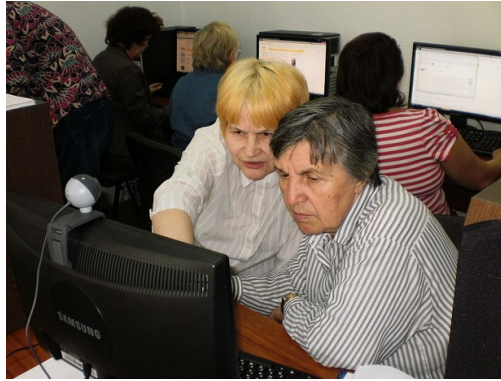
Учасники тренінгу для літніх людей у Харківському РТЦ

Крім тренінгів, програма проводить чимало цікавих заходів, як от Андріївські вечорниці та Львівська батярка. А у жовтні ц. р. відбувся Ярмарок можливостей для літніх людей, де представили роботу громадських організацій, центрів і клубів, які працюють зі старшими людьми. Також учасники могли отримати юридичну експрес-консультацію, взяти участь у майстер-класах зі спортивно-оздоровчої ходьби, бадмінтону, створення яворівської іграшки, ляльок з соломи та трави. Крім того, за підтримки Відділу преси, освіти та культури Посольства США в Україні Львівська міська рада, Інститут Громадського Лідерства та ГО «Самопоміч» вперше видали довідник пенсіонера, який містить перелік