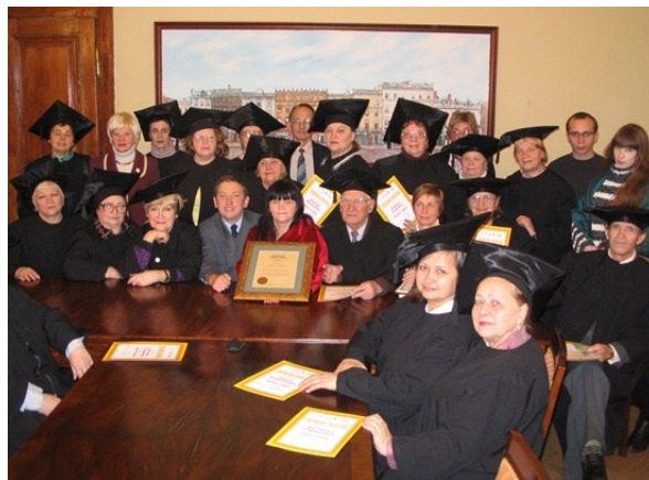
Випускники програми «Золоті роки» під час церемонії вручення дипломів

Кожен п'ятий українець досягнув похилого віку, тож зі старінням населення один з пріоритетів бібліотек – створити нові можливості для спілкування, навчання та саморозвитку. Львівські бібліотекарі вирішують це завдання у рамках програми «Золоті роки», яка пропонує пенсіонерам опанувати основи комп'ютерної грамотності та англійської мови,