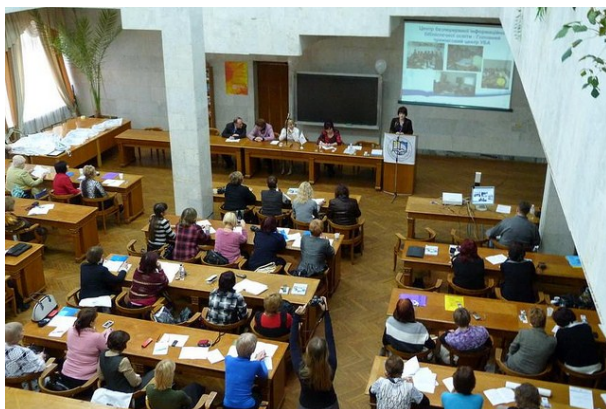
Друга щорічна Всеукраїнська науково-практична конференція «Інноваційна діяльність бібліотек»

У числі гостей на конференцію завітала делегація з Росії, очолювана генеральним директором Головного інформаційно-обчислювального центру Міністерства культури Російської Федерації Денисом Виноградовим. Російські колеги наочно презентували сучасні підходи до комплексної автоматизації бібліотек. Семінари, тренінги та презентації ознайомили з просуванням технологічних інновацій в бібліотеках, бібліотечними веб-сайтами, книжковими та інформаційними проектами та можливостями соціальних медіа. Дискусії, обмін досвідом, налагодження контактів з учасниками 14-го Київського міжнародного книжкового ярмарку «МЕДВІН: Книжковий світ-2011» допомогли