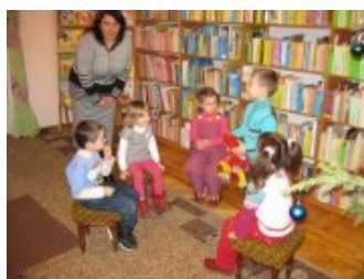
Захід для наймолодших читачів Тернопільської обласної бібліотеки для дітей

У 2007 році Тернопільська обласна бібліотека для дітей впоралася з черговою проблемою. Під час повеней на заході країни через відсутність гідроізоляції підвальне приміщення, де зберігався основний фонд, затопили підземні води. Бібліотекарі забили на сполох, адже постраждали понад 50% книг. «На мою думку, авторитет керівника сьогодні – це не тільки успішна діяльність установи, але і вміння при різних форсмажорних обставинах захистити права й інтереси як установи, так і працівників», –