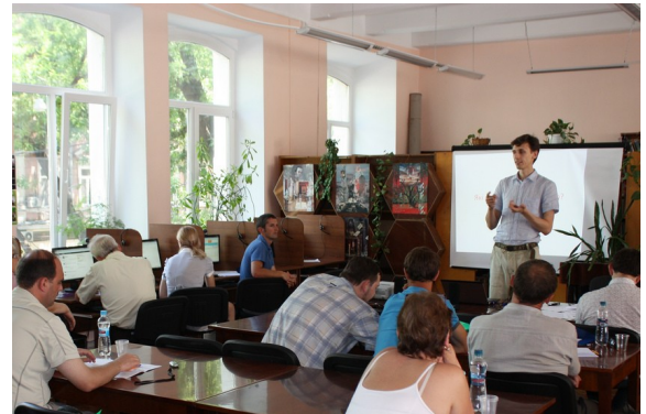
Міське відділення «Комітету виборців України» проводить семінар для журналістів в Одеській ОУНБ

На початку 2011 року партнери провели конкурс «Європа в Україні, Україна в Європі: