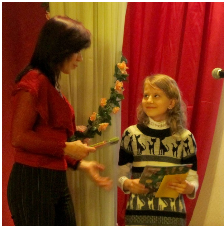
Юна акторка отримує нагороду за роль у бібліотечному фільмі

Коли фільм було завершено, його представили двом віковим групам дитячого журі – учням 5-7 та 8-9 класів. «Ми – дорослі учасники творчої групи – дуже хвилювалися! Та дітям фільм сподобався», – розповідають бібліотекарі. Оцінки були схвальними – школярі пропонували також запросити на