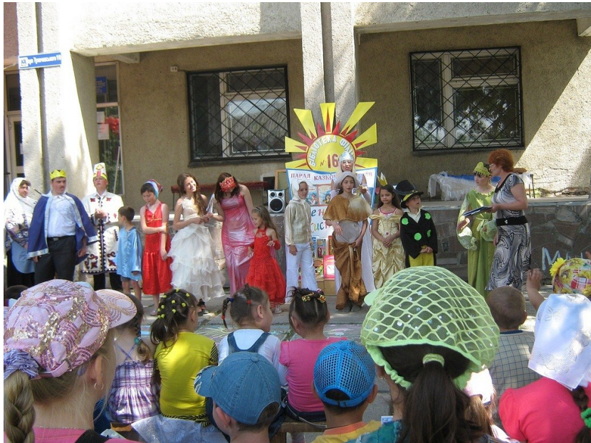
Захід для жителів мікрорайону Тернівка під стінами бібліотеки

Відгадавши бажання місцевих мешканців відпочити від спеки у вечірній час, подивившись хороший фільм, кілька бібліотек регулярно влаштовували сеанси протягом літа. Покази та обговорення відбувалися у Миколаївській центральній міській бібліотеці ім. М. Л. Кропивницького і Центральній міській бібліотеці ім. Лесі Українки у Дружківці на Донеччині. При Музиківській сільській бібліотеці на Херсонщині у час вечірньої прохолоди діяв кінотеатр під зоряним небом. Щосуботи бібліотекарі запрошували читачів усіх вікових категорій на сеанси, а також влаштовували голосування у соцмережах, щоб