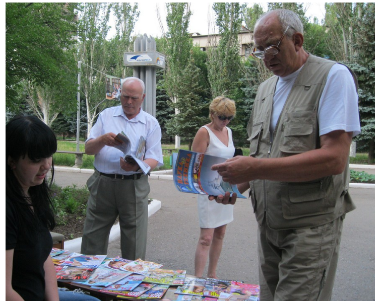
Дружківські бібліотекарі рекламують послуги свого закладу просто неба