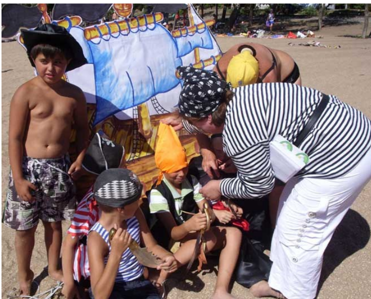
Маріупольські бібліотекарі дають останні настанови юним піратам перед грою

Усі ці приклади демонструють націленість бібліотекарів на творчий підхід до організації дозвілля своїх читачів, які знову і знову повертаються за чимось цікавим. Тож не баріться з ідеями, адже попереду ще достатньо теплих днів, а читачі завжди раді зустрітися з друзями поза стінами бібліотеки – якщо її працівники подбали про цікаву програму! ■