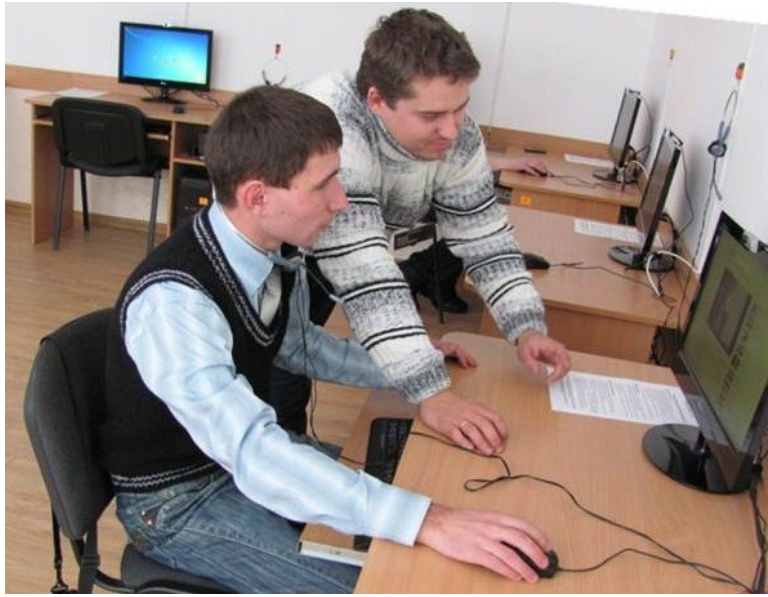
Відвідувачі сільської бібліотеки у Білій на Тернопільщині з задоволенням користуються новими послугами

сприяло зростанню її популярності: наразі її відвідує кожен п'ятий мешканець села. Люди різного віку потягнулися до бібліотеки, щоб оволодіти навичками використання комп'ютера, отримати необхідну інформацію та поспілкуватися з родичами. Коли велася онлайн-трансляція святкування Дня села, до людей телефонували рідні з Кореї, Чехії, Сполучених Штатів Америки, Аргентини та казали, що дуже щасливі бачити такі позитивні зміни. У майбутньому в селі планують створити музей і залучати туристів, у тому числі через інтернет.