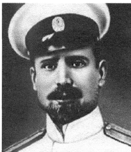
Седов Георгий Яковлевич (1877-1914)