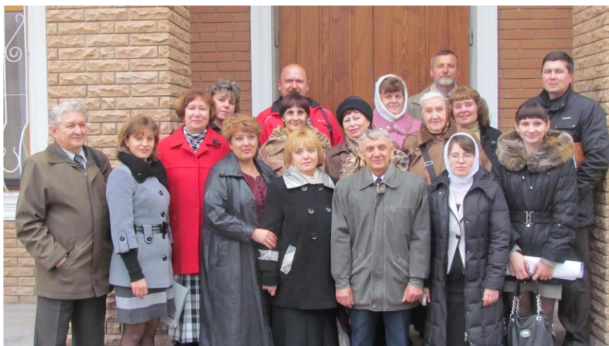
Конференция краеведов в с. Сергеевка (2012)