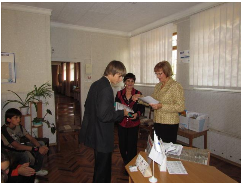
Подведение итогов проекта «Библиотечный краеведческий туризм». Награждение лучших воспитанников (2011)