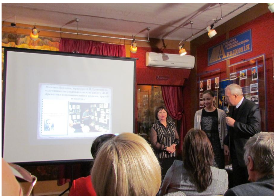
Подведение итогов проекта «Год Древетняка в Краматорске» (2012)