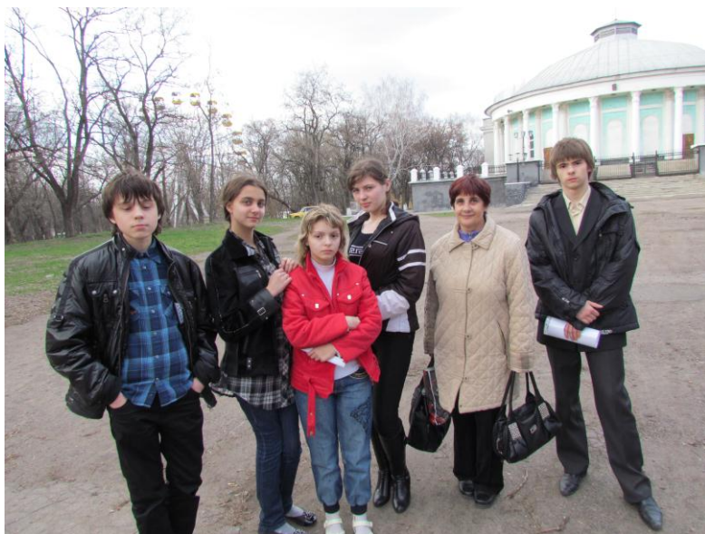
Участие воспитанников клуба «Самоцвет» в проекте «Библиотечный краеведческий туризм» (2011)