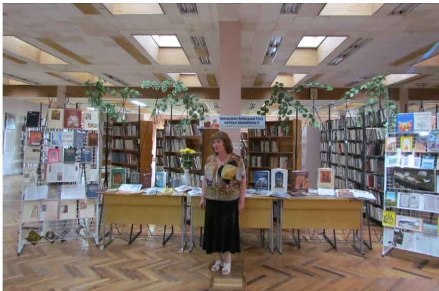
Открытие выставки в Центральной библиотеке «Крещение Киевской Руси: истоки православия» (к 1025-летию) (2013 г.)