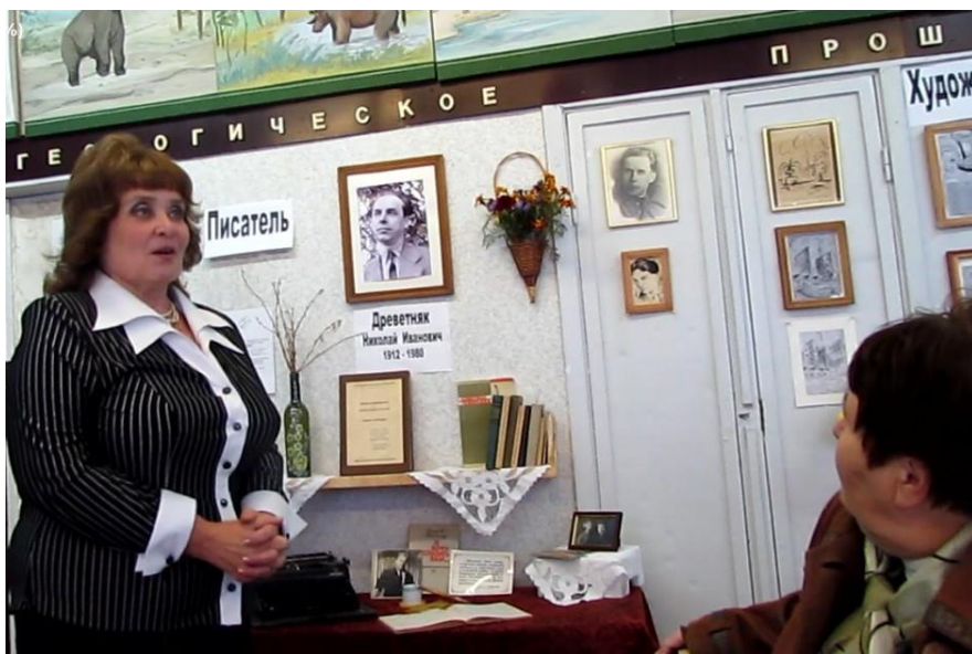
Открытие выставки ЦВР «Писатель. Художник. Краевед» (2012)