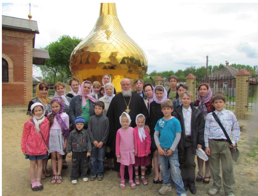
Знакомство ребят с историей православных храмов города (2011)