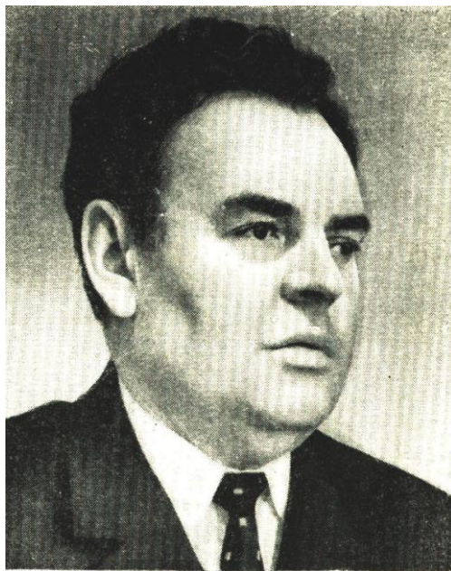
3. Стихи Н.А. Рыбалко в переводе на украинский язык А. Провозиным

Звучало здесь: «Я жил в такие времена», Потом: «Пока сердца для чести живы». Хоть в наши дни не та уже страна, Не те уже свершенья и порывы, - Народ не забывает эти имена!