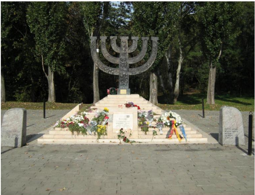
«Менора» (архітектор Ю. Паскевич, інженер Б. Гіллер, художники Я. Левич, І. Левич) 1991 рік

Фашистські карателі знищували тут за національною належністю євреїв і ромів - жінок, стариків і дітей, за ідеологічною – комуністів і комсомольців, а також тих, хто чимось не догодив владі „вищої раси”.