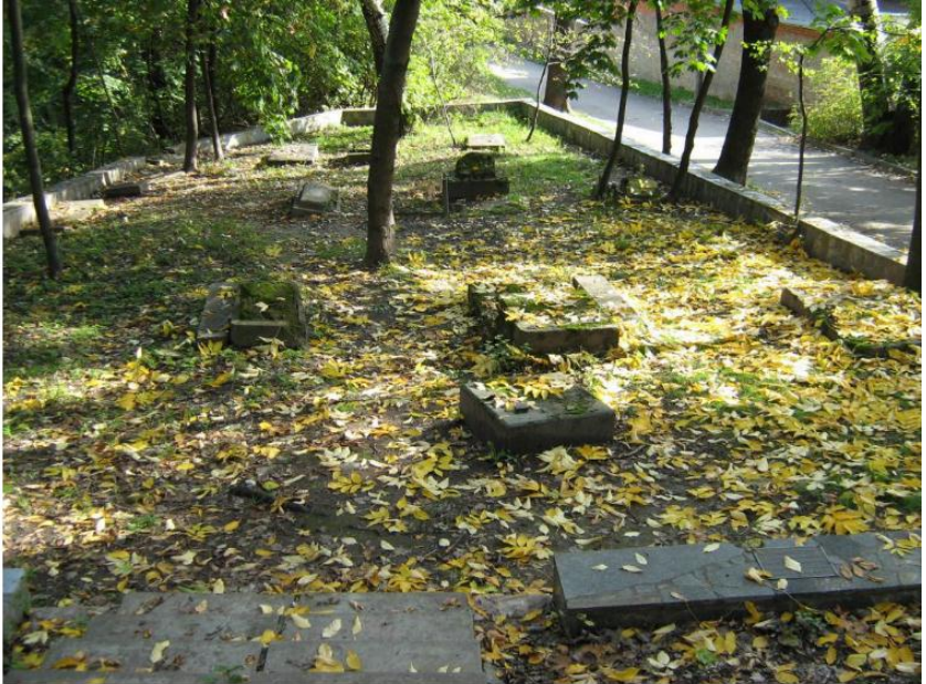
Могильні плити із колишнього єврейського цвинтаря