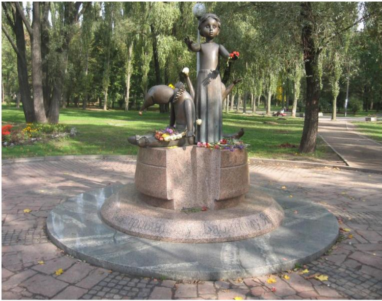
Пам'ятник розстріляним дітям у Бабиному Ярі (скульптор В. Медведєв, архітектори Р. Кухаренко і Ю. Мельничук)