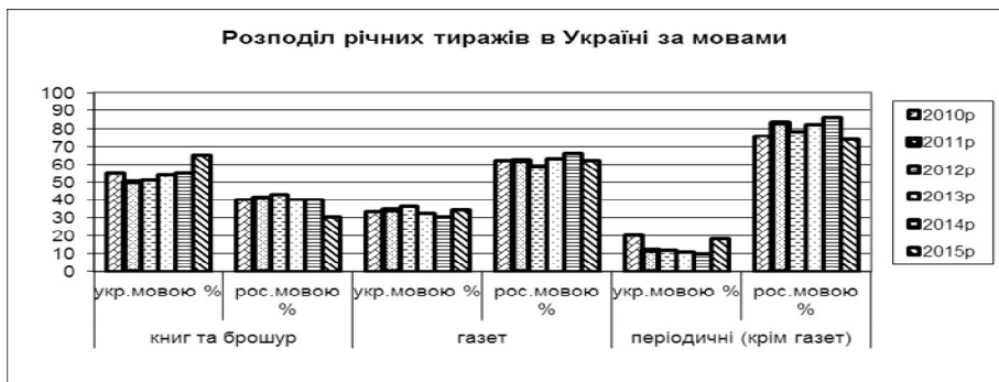
Рис. 1. Діаграма розподілу річних тиражів друкованої продукції в Україні

Як показує інформаційна табл.1 майже не змінилась за аналізований період пропорційність у виданні газет ( 2010р. – 33% - україномовні, 62% - російськомовні; 2015р. . – 34% - україномовні, 62% - російськомовні); інших періодичних видань (2010р. – 20% - україномовні, 76% - російськомовні; 2015р. . – 18% - україномовні, 74% - російськомовні). Тобто в двічі більше друкується російськомовних газет, в чотири рази більше інших періодичних видань. Щодо видавництва книг та брошур то є позитивні зрушення: питома вага україномовних видань зросла з 55% до 65%.