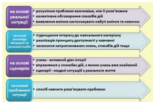
Табл.5 Історії можуть бути побудовані

Дуже цікавими та ефективними є включення в історію словникових слів, що супроводжуються схематично – малюнковою мнемонікою. Чим кумедніші і простіші історії – небувалиці, тим швидше запам'ятають їх читачі,