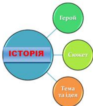
Табл. 1. Складові частини історії: